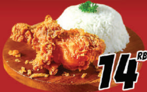
Paha Bawah + Nasi