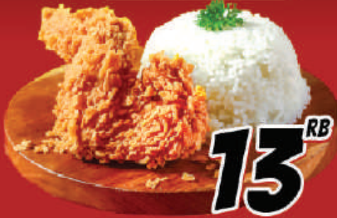
Sayap + Nasi